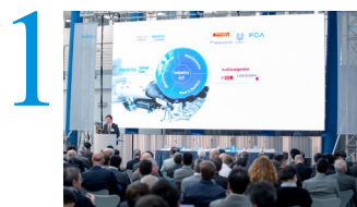
Venerdì 18 marzo 2016 Festo Italia, Assago (MI)