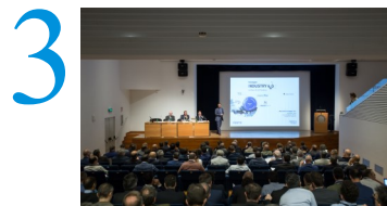
Mercoledì 10 maggio 2017 Fondazione Ferrero, Alba (CN)