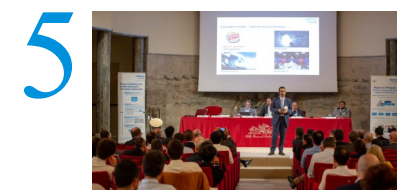
Giovedì 10 maggio 2018 Villa Fenaroli, Rezzato (BS)