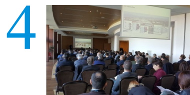
Giovedì 16 novembre 2017 Palazzo di Varignana, (BO)